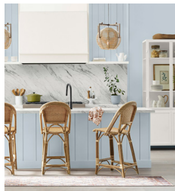
Upward SW 6239