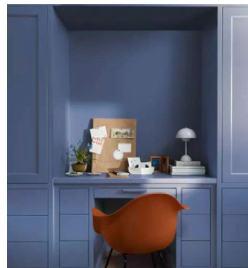
Blue Nova 825