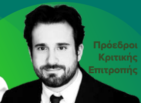
Πρόεδροι Κριτικής Επιτροπής

Καθηγήτρια Περιβαλλοντικής Εκπαίδευσης, Αγωγής και Επικοινωνίας, Πρόεδρος Τμήματος Δημόσιας και Κοινωνικής Υγείας Σχολή Δημόσιας Υγείας, Πανεπιστήμιο Δυτικής Αττικής